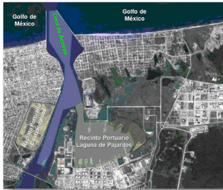
Imagen 2. Ubicación del Recinto Portuario Coatzacoalcos y Recinto Portuario de la Laguna de Pajaritos, municipio de Coatzacoalcos, estado de Veracruz, México.

Las principales instalaciones para las operaciones portuarias y los recursos de infraestructura para uso común, que dispone el Puerto de Coatzacoalcos son: obras de protección, señalamiento marítimo, áreas de agua, obras de atraque, vías férreas, vialidades, andadores, edificios, áreas de almacenamiento.